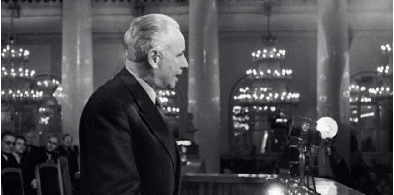
Louis Aragon au deuxième congrès des écrivains soviétiques, Moscou, 1954.