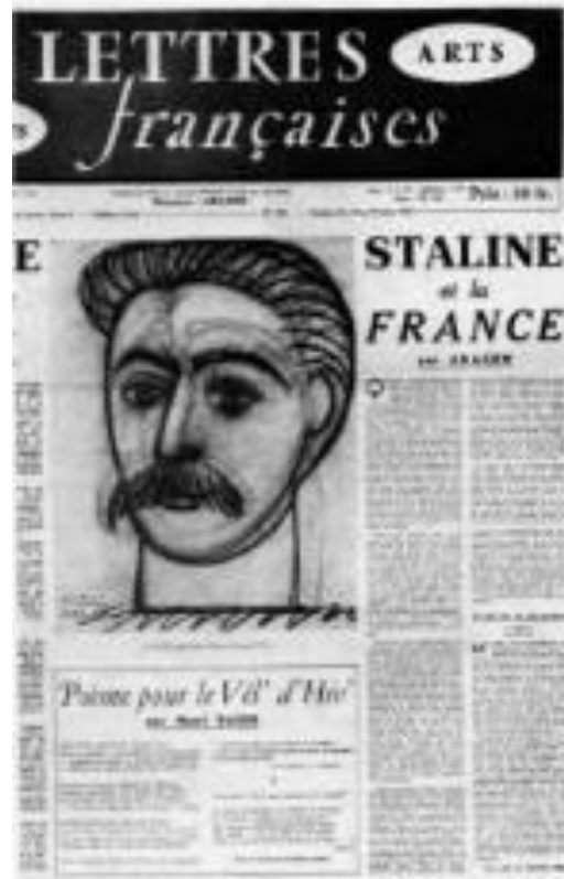
«Staline et la France», par Louis Aragon, avec un portrait du tyran par Picasso (Les lettres françaises, mars 1953,)